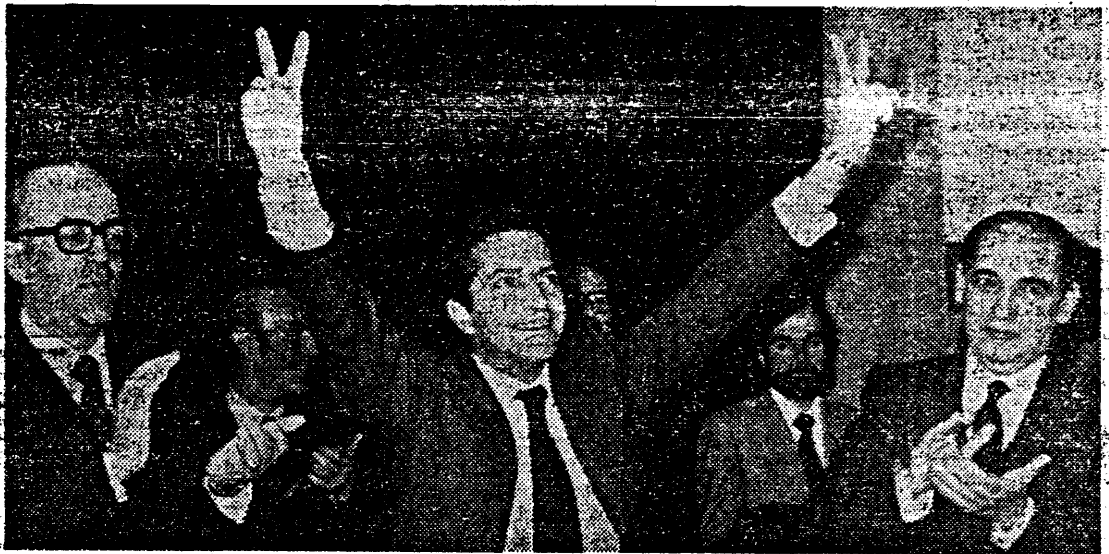
Är det valets segrare som vågar göra segertecknet redan på sista kampanjmötet? Premiärminister Suarez omges av partikamraterna Leopoldo Calvo Sotelo (t. v.) och Antonio Fontán.

Enligt undersökningen uppger sig 77,7 procent av väljarna ämna rösta den 1 mars. Undersökningen genomfördes den 19-21 februari och 18 800 intervjuades.