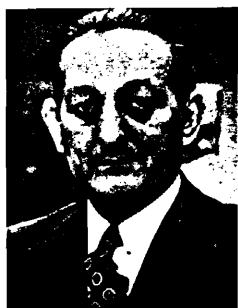
TORCUATO FERNANDEZ MIRANDA

—¿Qué son y qué significan para usted los Principios Fundamentales del Movimiento Nacional?